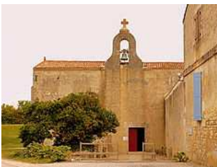
Église abbatiale Saint-Martin.

L'église actuelle apparaît comme particulièrement mutilée, se limitant à l'ancien transept, à une petite absidiole (greffée sur l'ancien croisillon nord) ainsi qu'à une crypte romane aménagée entre le XI e siècle et le XII e siècle. Restaurée de 1964 à 1971, elle est couverte d'une voûte d'arêtes portée par une série de 14 colonnettes aux chapiteaux ornés de motifs floraux, rare témoignage du premier art roman saintongeais.